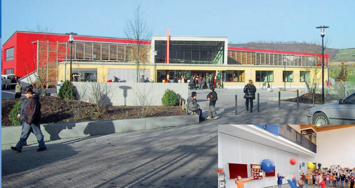
Grundschule „Im Weidengrund“