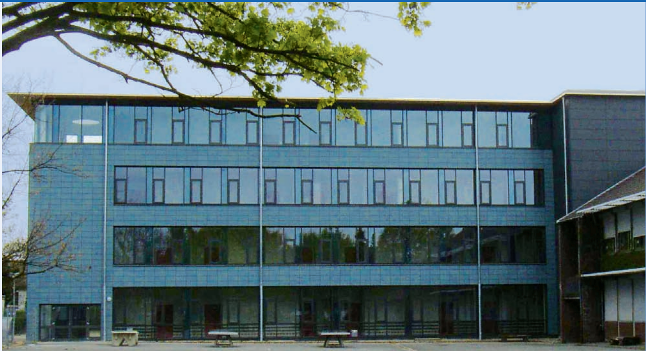
Fachraumtrakt für Hauptschule und Realschule