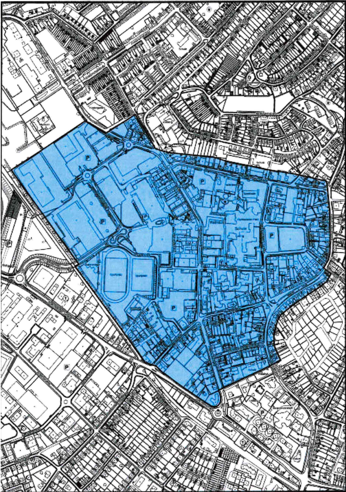
AUSZUG AUS DER AMTLICHEN BASISKARTE c.M. 61 MR JANUAR 2020